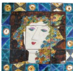
Teresa Cortez, Primavera, 1989 Painel cerâmico relevado, Museu Nacional do Azulejo

Esta estação, que representa o renascer da natureza e o aumento gradual da luz do dia, estende-se até ao solstício de verão em 21 de Junho.